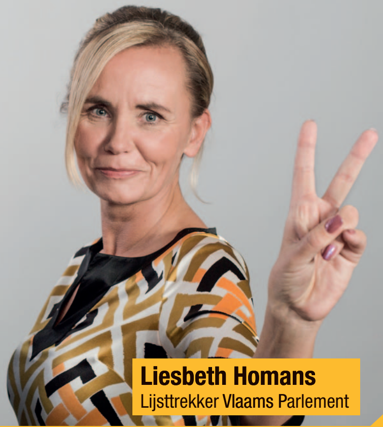
Liesbeth Homans Lijsttrekker Vlaams Parlement

Als burger, als vader en als burgervader zoek ik elke dag oplossingen voor en het welzijn van iedereen die werkt, spaart en onderneemt. Maar zolang we België niet hervormen, staan we machteloos tegenover de hoge belastingen, de faillissementengolf, de verkwistende structuren.