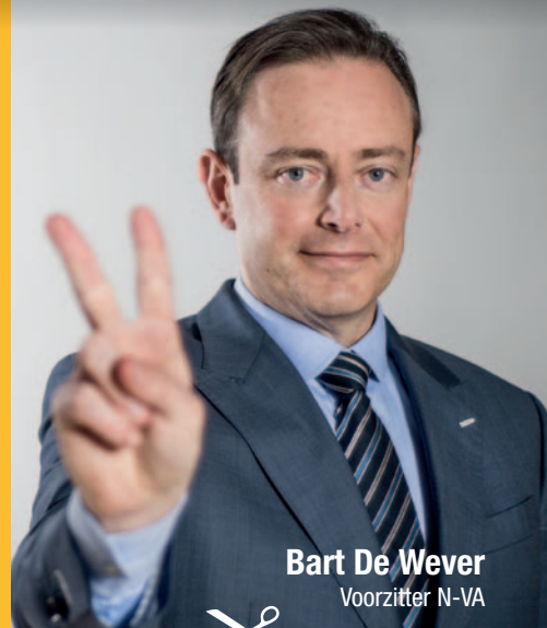
Bart De Wever Voorzitter N-VA