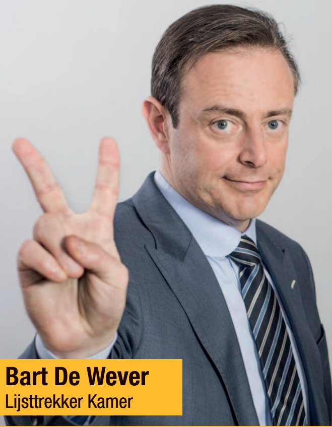
Bart De Wever Lijsttrekker Kamer