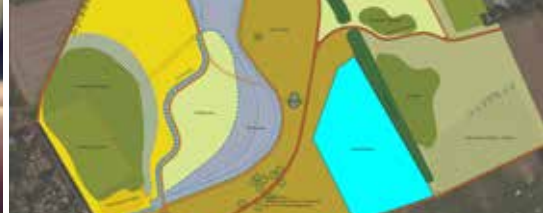
Landschapspark Frijthout groeit (p.3)