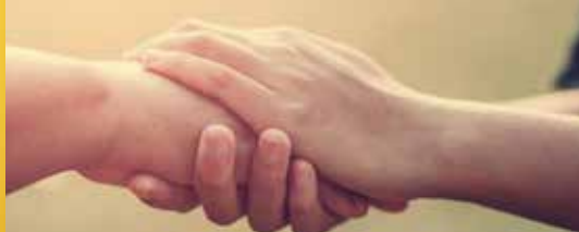
Het OCMW is er ook voor jou (p.2)