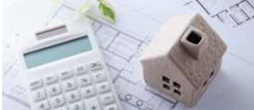
Sociale woningbouw in Hove p.2