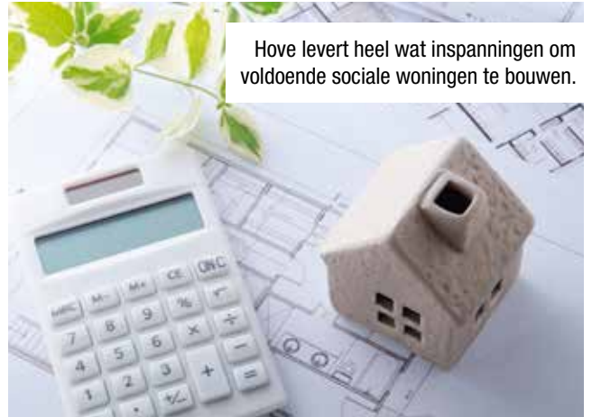
Hove levert heel wat inspanningen om voldoende sociale woningen te bouwen.

Wie ons dus verwijt dat we enerzijds Hove volbouwen en anderzijds onvoldoende sociale nieuwbouw voorzien, heeft dus overduidelijk geen oog voor alle inspanningen die de gemeente levert.