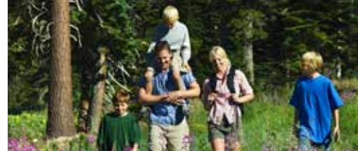
Open natuur blijft behouden p.3